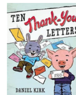
TEN THANK YOU LETTERS