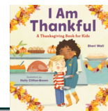
I AM THANKFUL